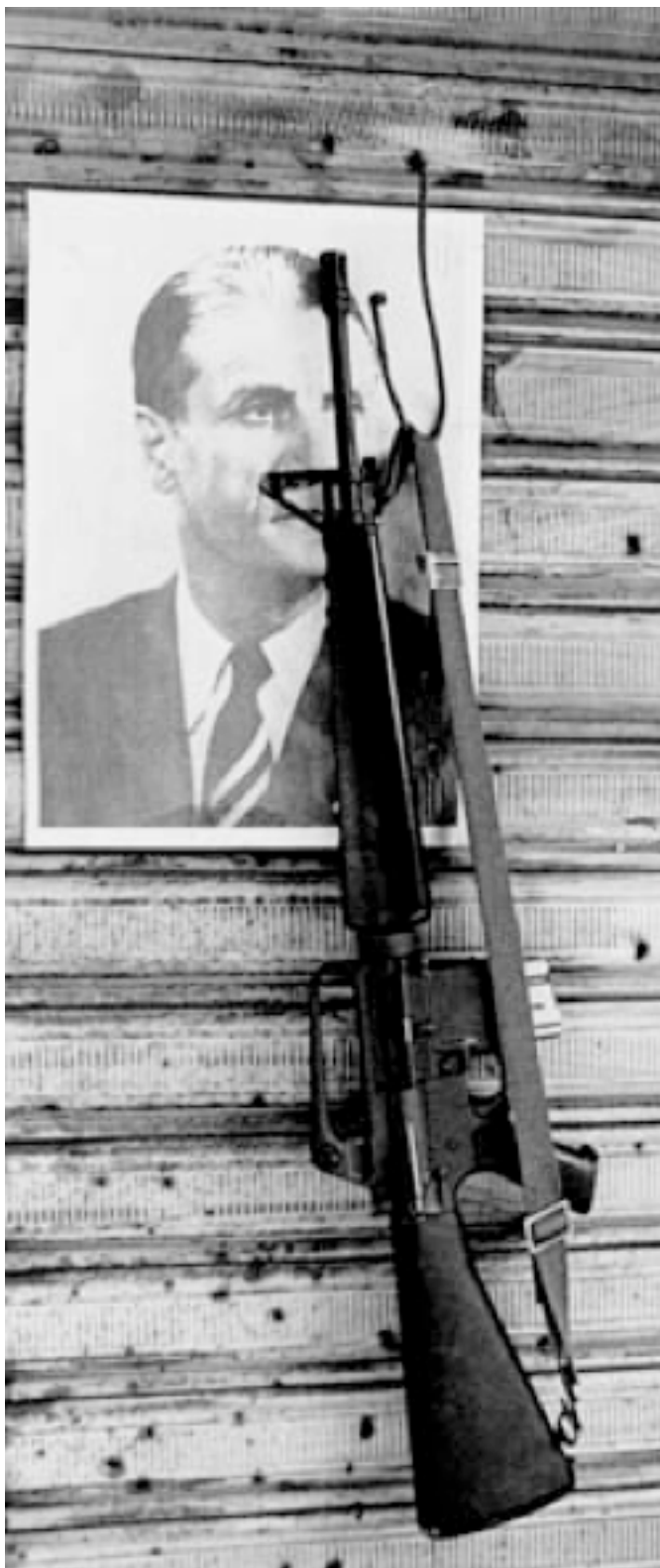
Рис. 4. Пьер Жмайель, 1978.

Следующий за Насером президент Египта Анвар Садат вообще служил в частях Вермахта.