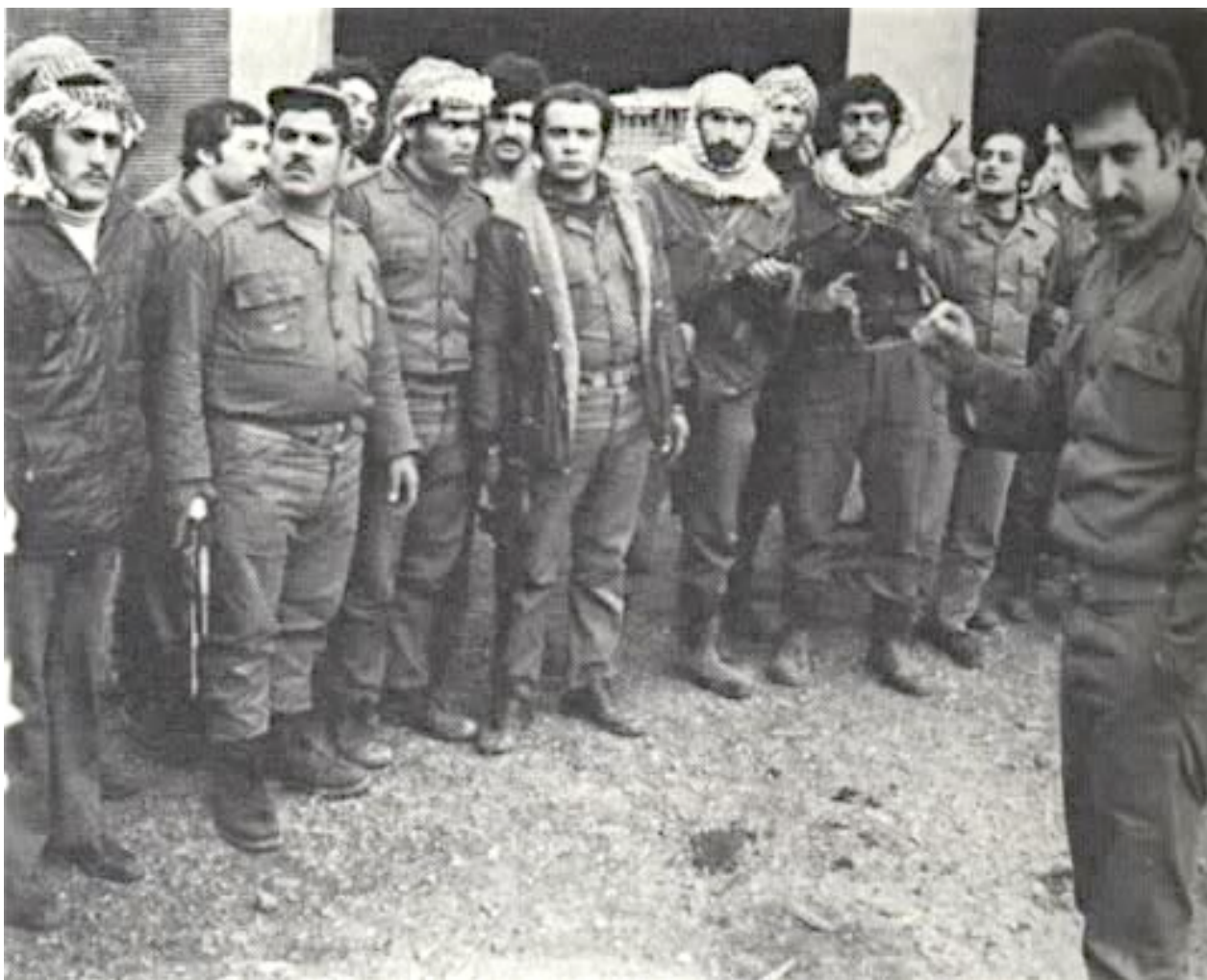
Рис. 6. Арабская армия Ливана.

мусульманские общины, чтобы реформировать политическую систему страны. Джумблат выдвинул в августе 1975 г. программу политических преобразований, осуществление которой, по мнению лидеров Национально-патриотических сил, было необходимым условием прекращения внутренних военных междоусобиц. В общей сложности ООП и её сторонники имели более 46 тысяч бойцов (рис.6), т.е. в три с лишним раза превосходили численность ливанской армии и христианских милиций.