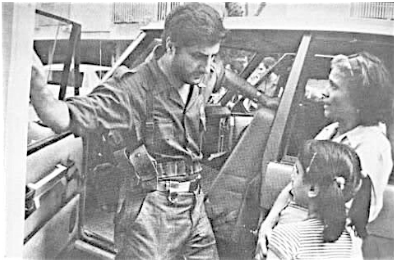
Рис.11. Один из лидеров христиан-фалангистов, сын Пьера Жмайеля - Башир Жмайель.

расположен к югу от дороги, связывавшей Бейрут и Дамаск. Потеря Голанских высот поставила Сирию в крайне невыгодное военно-стратегическое положение по отношению к Израилю. Размещение сирийских войск в Ливане позволило бы несколько выровнять соотношение сил.