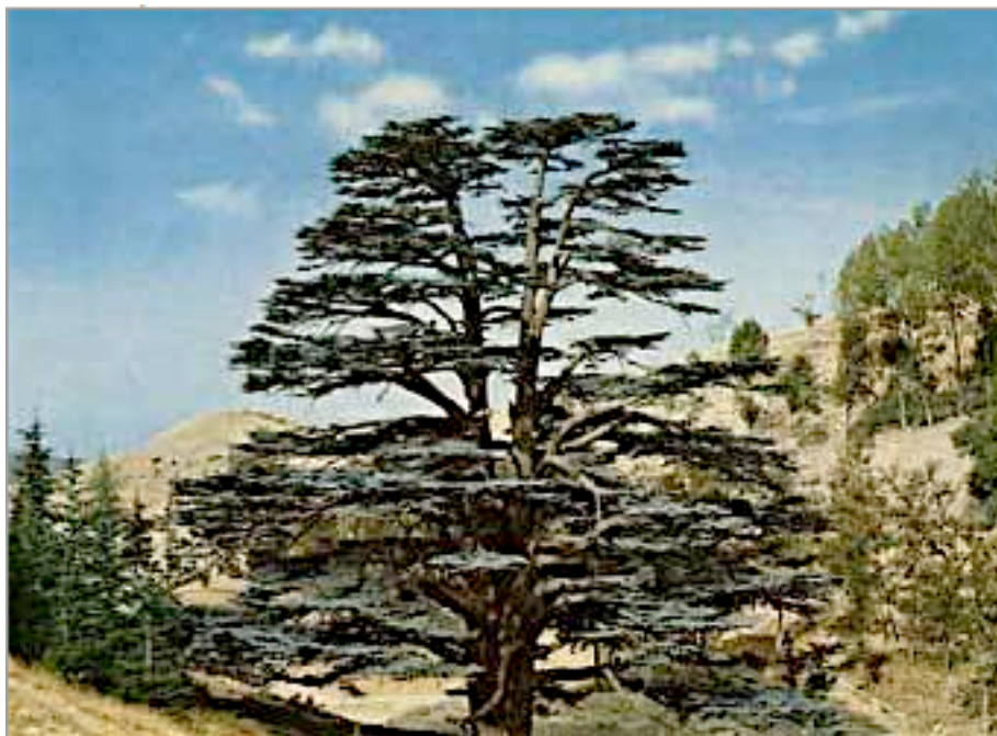
Рис. 2. Символ Ливана - ливанский кедр.

протяжении веков смешивались с соседями и захватчиками: ассирийцами, египтянами, персами, греками, римлянами, арабами, европейскими крестоносцами.