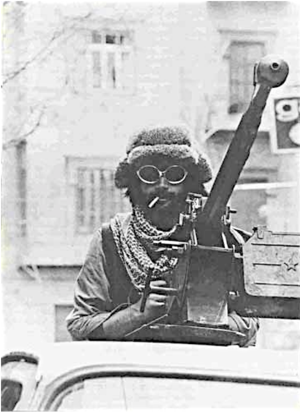
Рис. 8. Боец отрядов Саика.

В ответ фалангисты выставили в Бейруте блок-пост, на котором расстреливали всех попавших к ним в руки мусульман из расчета 10 мусульман за одного погибшего фалангиста. В ответ мусульмане выставили свой блок-пост, на котором расстреливали христиан. За день боев и казней погибло 350 человек с обеих сторон.