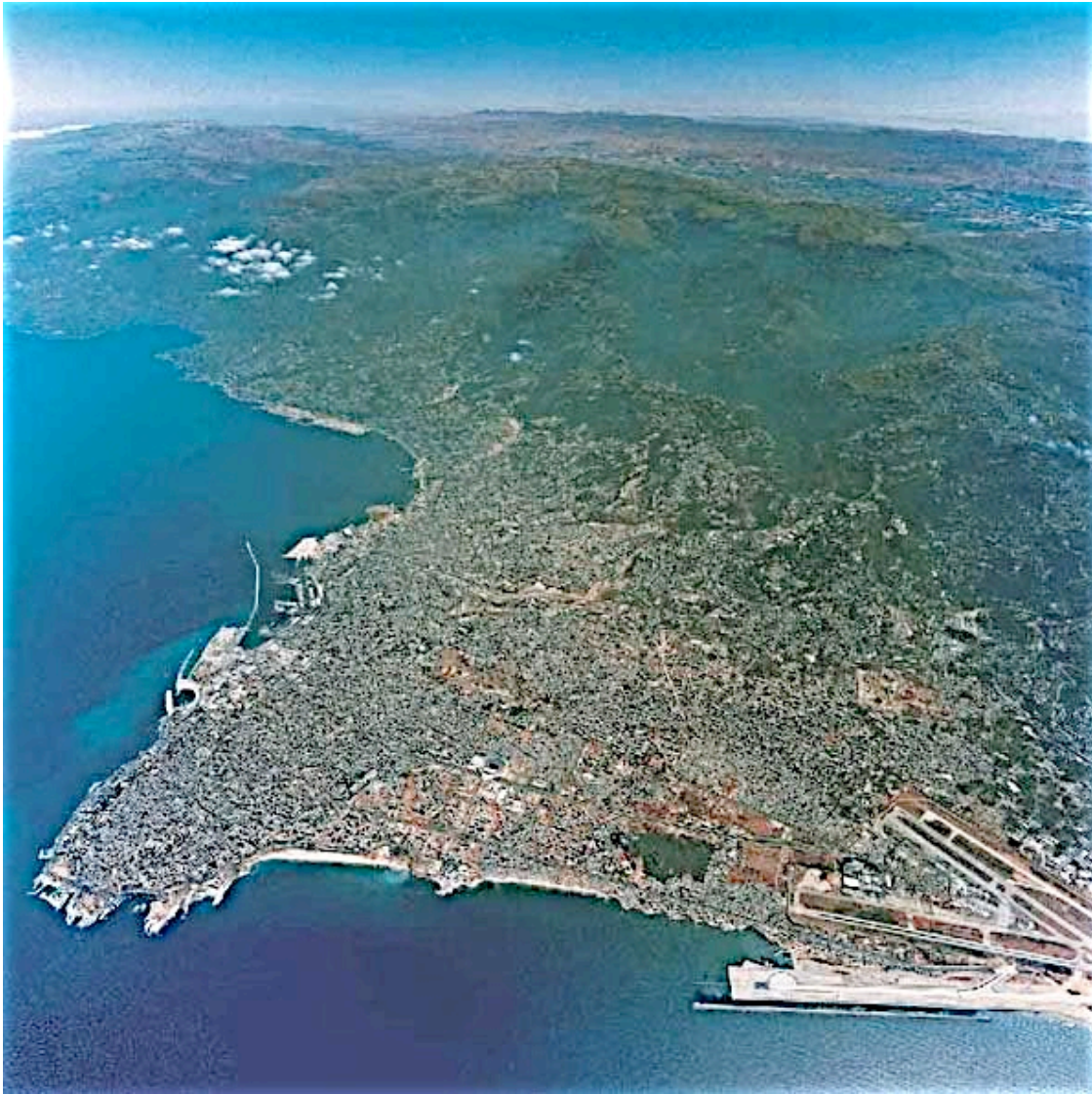
Рис. 3. Бейрут - жемчужина Ближнего Востока середины 60-х годов.

В то же время, к концу 60-х годов мусульманское население Ливана превысило его христианское население. Консенсус, закрепленный конституцией страны, оказался под угрозой. Ливан стремился избежать вмешательства в арабо-израильские войны 1967 и 1973 гг. Однако после 1967 года из лагерей беженцев в Ливане палестинские партизаны неоднократно наносили удары по Израилю. С его стороны последовали ответные вооруженные акции, и ливанское правительство попыталось ограничить военные вылазки палестинцев со своей территории. Окончательно дестабилизировала ситуацию гражданская война в Иордании, в ходе которой король Хусейн изгнал из Иордании вооруженные отряды Организации Освобождения Палестины (ООП). Приток в страну палестинских партизан поставил Ливан в центр противостояния между Израилем, Сирией и палестинцами, а также расколол ливанское общество по вопросу пребывания ООП в Ливане и участия палестинцев в политической жизни страны.