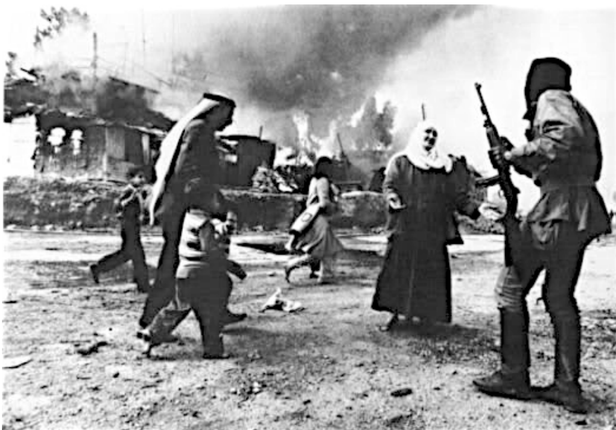
Рис. 9. Штурм Карантины.

Палестинцы обвиняют фалангистов в намеренном истреблении мирных жителей, что было абсолютной правдой. В мире прокатилась волна возмущения действиями фалангистов. Симпатии мирового сообщества склонились в сторону палестинцев.