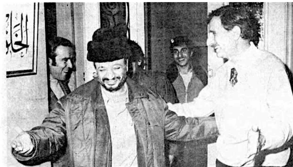
Рис. 5. Ясир Арафат и Камаль Джумблат.

Мусульманская община Ливана, со своей стороны, выступила в поддержку ООП. Ближайшим их союзником стали Национально-патриотические силы Ливана (НПС) во главе с Камалем Джумблатом (рис.5) .