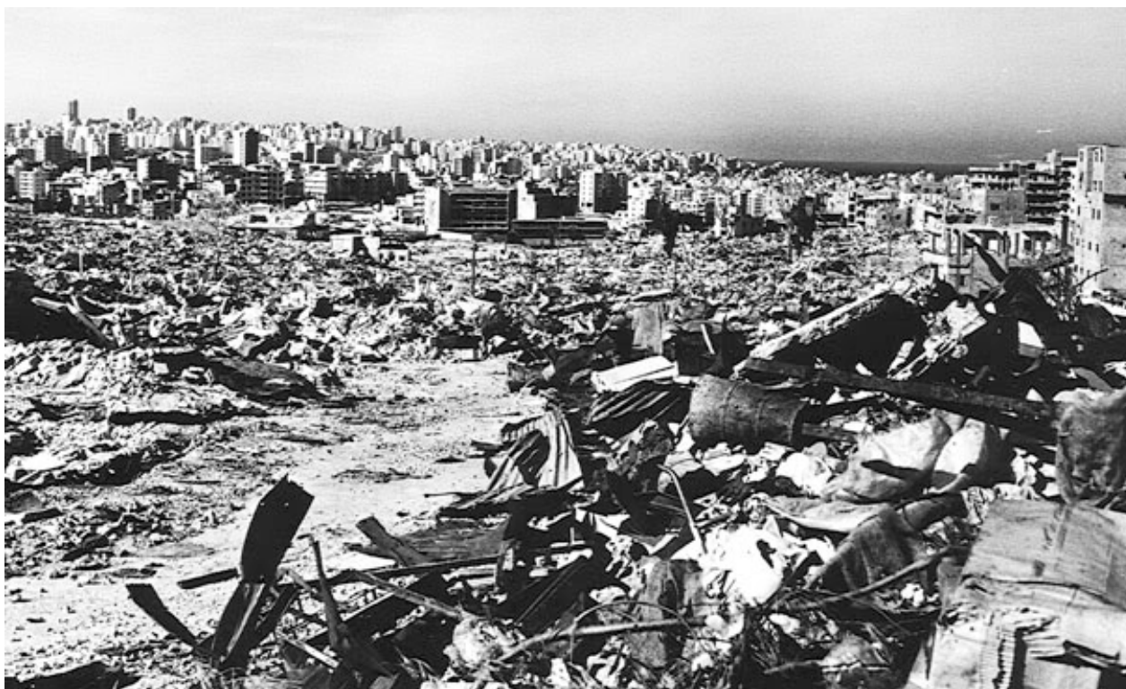
Рис.12. Таль Заатар после взятия его фалангистами.

В соответствии с решениями, принятыми в Эр-Рияде, на всей территории Ливана, за исключением районов к югу от р.Эль-Литани, по которой проходила «красная линия», установленная Израилем, были развернуты МСС.