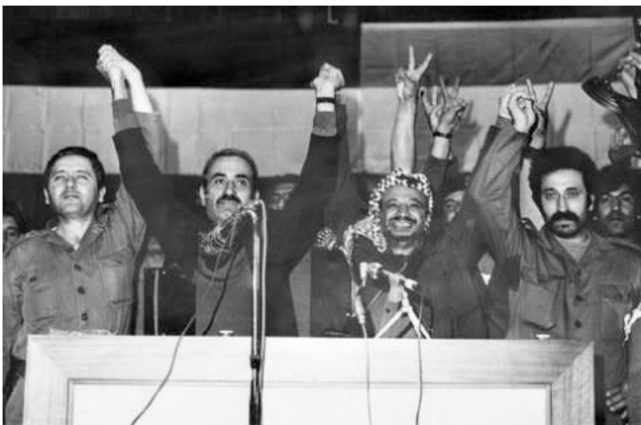
Рис. 10. Лидеры палестинцев и Ливанской Арабской Армии объявляют о победе.