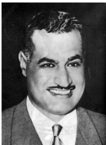
Рис.4. Г.А. Насер.

Вторая война вспыхнула спустя семь лет. Она началась в 1956 г. из-за противоречий Великобритании, Франции и Египта по поводу статуса Суэцкого канала и получила название Суэцкого кризиса. Канал был совместным египетско-французским проектом, однако на бытовом уровне египтяне считали его своим. Еще в 1951 г. начались нападения на британских солдат, охранявших канал, но тогда конфликт удалось погасить. После прихода к власти в Египте президента Насера (рис.4) Великобритания попыталась урегулировать конфликт и подписать с Египтом новый договор. По договору канал