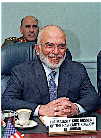
Рис. 6. Король Иордании Хусейн.

превосходства. Советский Союз разорвал дипломатические отношения с Израилем. Поражение арабских армий, вооруженных достаточно новым советским оружием, вызвало шок в военно-политических кругах СССР.