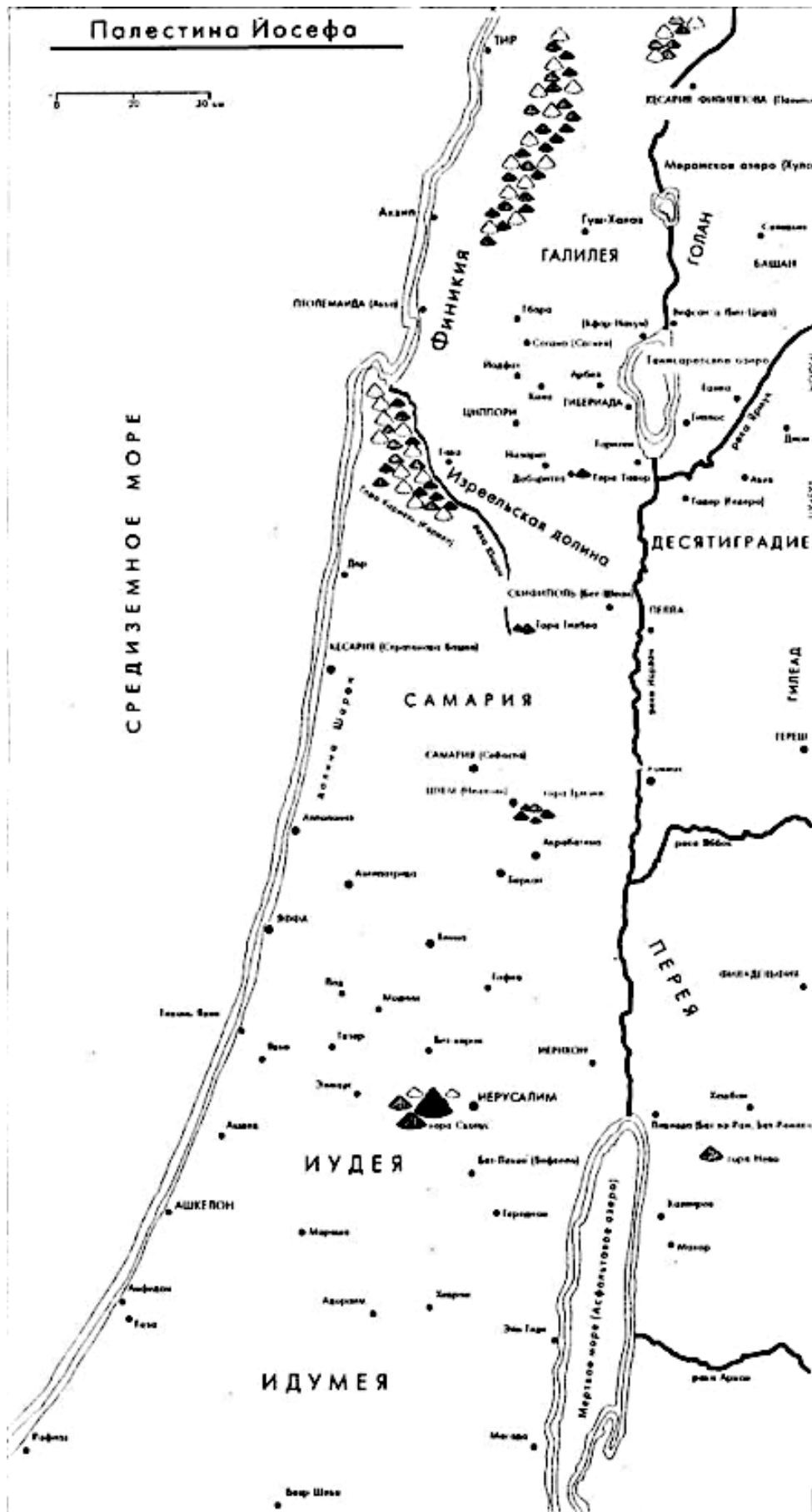
Рис. 1. Карта древней Палестины.