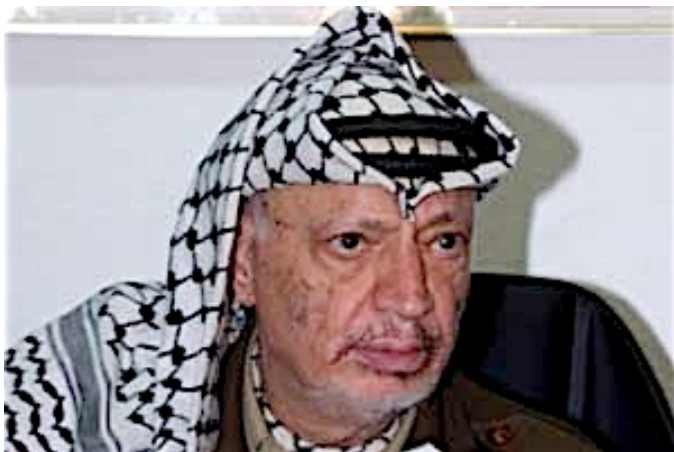
Рис. 5. Председатель исполкома ООП Я.Арафат.

Арабские страны имели в 1967 г. многократное численное превосходство. Авиационная техника, выставленная на аэродромах, как на параде, демонстрировала могущество объединённых арабских вооружённых сил. Технический уровень вооружения арабских стран и Израиля был примерно равным, что укрепило в руководстве СССР твердое мнение: в